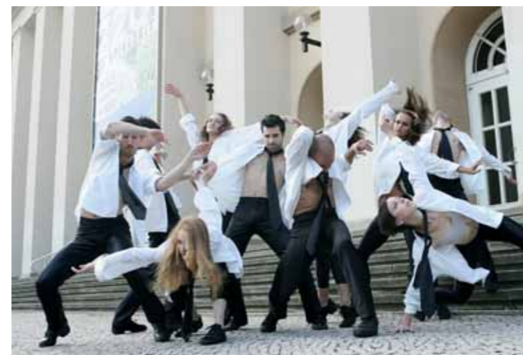
Foto: Ballettensemble des Anhaltischen Theaters Dessau

Tanztheater von Tomasz Kajdanski zu Musik von Kurt Weill, Paul Hindemith und Arnold Schönberg Premiere am 28. Februar 2015 um 19.30 Uhr im Anhaltischen Theater Dessau