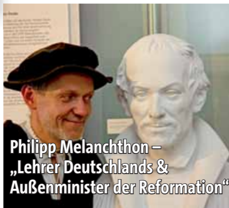
Philipp Melanchthon – „Lehrer Deutschlands &amp; Außenminister der Reformation“

Philipp Melanchthon war wichtigster Mitarbeiter Martin Luthers und Diplomat der Reformation. Noch heute wird er als „Lehrer Deutschlands“ bezeichnet. Zu ihm kamen an der damals wichtigsten Universität Europas die meisten Studenten. An sieben authentischen Orten in der Altstadt Wittenbergs wird sein Wirken anschaulich deutlich. Lassen Sie sich einladen in die Gedanken- und Lebenswelt dieses kleinen aber großartigen Mannes. Mit einem kleinen Spiel, etwas Gesang und einer Köstlichkeit.