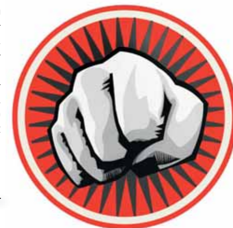
Motiv: Werbemotiv für „Götz von Berlichingen“

Johann Wolfgang von Goethes »Götz von Berlichingen« steht als berühmtestes Drama des Sturm und Drang für den Kampf einer alten Macht gegen ein neues Recht. Der Ritter mit der eisernen Hand, den der erst 22-jährige Dichter bereits 1771 erstmals in den Blick nahm, verläuft sich zwischen den Fronten der Glaubenskriege und in der intriganten Welt des Adels. Vergebens verteidigt er das, was er für sein natürliches Recht hält, gegen die abstrakten Gesetze seiner Umwelt – und ist am Ende zum Untergang verurteilt.