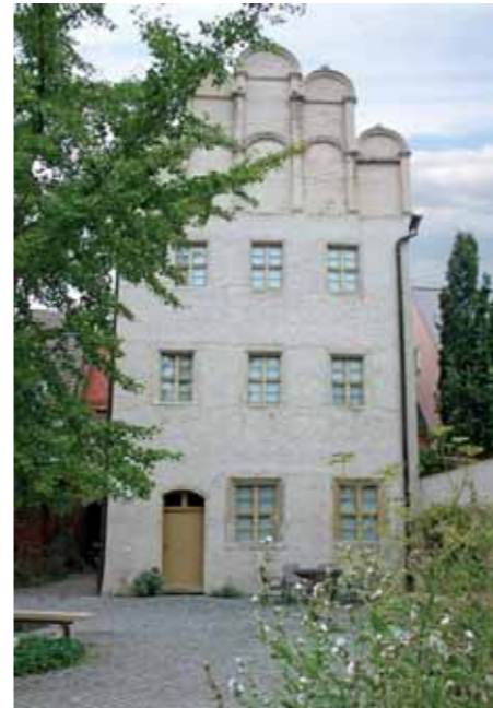
Melancthonhaus, Lutherstadt Wittenberg