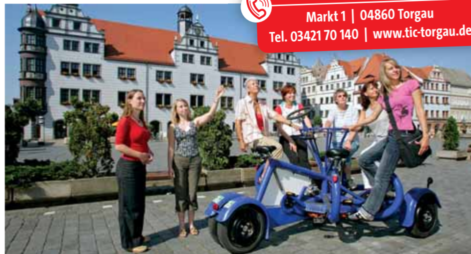
Die Stadt lässt sich auch bei einer Tour mit dem Torgauer Geschichtsrade erkunden

Markt 1 | 04860 Torgau Tel. 03421 70 140 | www.tic-torgau.de