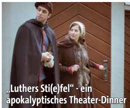
„Luthers Stif(e)fel“ - ein apokalyptisches Theater-Dinner

Fragen Sie die Tourist-Information Tel. 03491-49 86-10