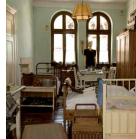
Haus der Geschichte / Flüchtlingszimmer