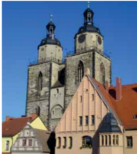
Stadtkirche St. Marien, Lutherstadt Wittenberg