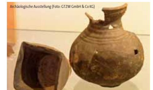
Archäologische Ausstellung

Kehren Sie zur Anfangszeit der Wittenberger Stadtgeschichte zurück und erfahren Sie alles über die Ursprünge der Stadt.