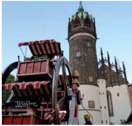
Schlosskirche, Lutherstadt Wittenberg

Die kunstvollen Fenster stammen von Gönter Grohs. Die Kirche hat eine enge Verbindung zu den evangelischen Gemeinden und als Zeichen der Gemeinsamkeit steht ein Kreuz auf dem Apollenberg.