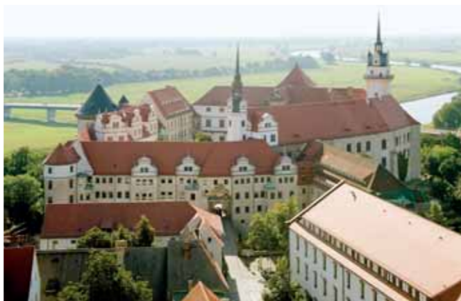
Panoramafoto Schloss

Eine Ausstellung im Schloss Hartenfels, in der Kurfürstlichen Kanzlei und der Superintendentur lässt auf mehr als 1000 Quadratmetern an historischem Ort mit einzigartigen Kunstwerken, Dokumenten und Kostbarkeiten die Zeit der Reformation wiedererleben. Einen Sommer lang können die fürstliche Pracht und das Selbstverständnis der Herrscher zur Zeit Martin Luthers erlebt werden. Die Ausstellung bildet den Auftakt der vier Nationalen Sonderausstellungen zum 500-jährigen Reformationsjubiläum. Mit der Veröffentlichung von Luthers 95 Thesen erfasste die Reformation alle Lebensbereiche der Gesellschaft. Ihre Wirkungskraft verdankte sie insbesondere dem Eintreten der protestantischen Fürsten, allen voran der sächsischen Kurfürsten. Heute zeugt Torgau wie kaum eine andere Stadt in Deutschland von dieser Epoche.