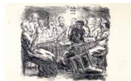
Max Beckmann „Das letzte Abendmahl“, Teil der Ausstellung „Cranach und die Moderne“

Vor 500 Jahren wurde Lucas Cranach der Jüngere geboren. Er folgte den Fußstapfen seines berühmten Vaters und lernte bei ihm das Malerhandwerk. Schließlich übernahm er dessen Werkstatt, in der Werke für den kursächsischen Fürstenhof, für wohlhabende Auftraggeber und die Kirchen der Region entstanden. Wie auch sein Vater prägte er die Bildsprache der Reformation entscheidend mit und gibt den Akteuren jener Zeit mit seinen Porträts ein Gesicht. Im zu Ehren öffnet am 26. Juni 2015 die Landesausstellung Sachsen-Anhalt „Cranach der Jüngere“ ihre Tore zu sechs Ausstellungsvorhaben in Wittenberg, Dessau und Wörlitz.