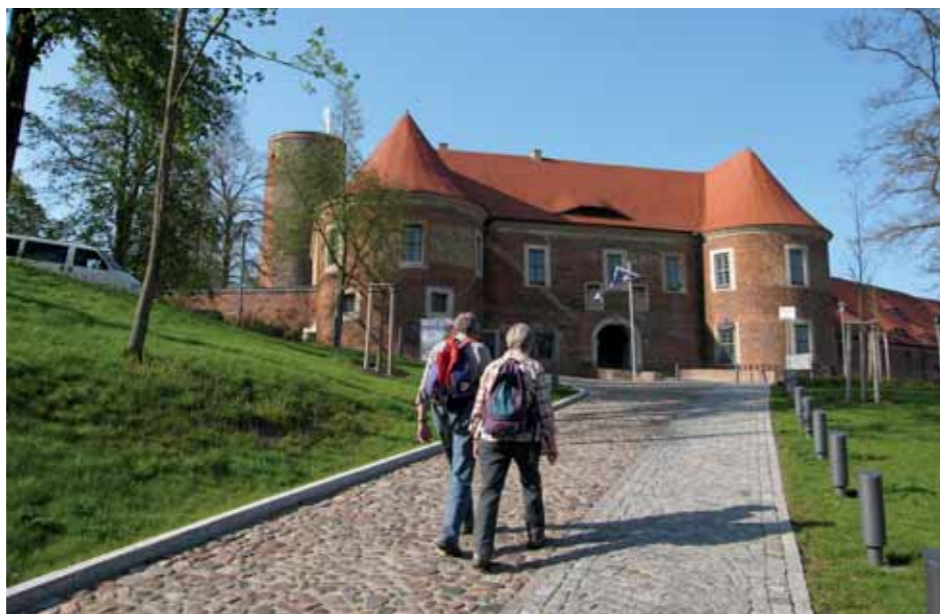
Burg Eisenhardt in Belzig

Kulturliebhaber finden in der Erlebnisregion Fläming zahlreiche Museen, Burgen, Klöster und historische Stadtkerne. Vor allem Mittelalterfeste und Theateraufführungen im Ambiente der Burgen begeistern immer wieder ihre Besucher. Im Burgkeller der Burg