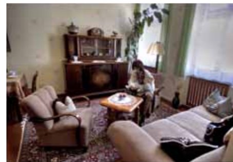
Haus der Geschichte / Gute Stube 40er Jahre