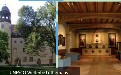
UNESCO Welterbe Lutherhaus