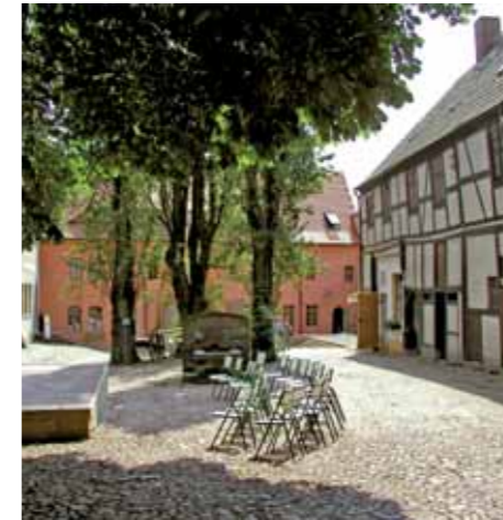
Cranachhof, Lutherstadt Wittenberg

Begeben Sie sich auf eine Zeitreise in die Vergangenheit und erhalten Sie Aufschluss über typische Designs aus den 40er bis 80er Jahren. Erfahren Sie mehr über das Alltagsleben in der ehemaligen DDR. Besuchen Sie die Ausstellung „Wegzeichen – Zeitzeichen“ und informieren Sie sich über die ostdeutsche Geschichte und über das Leben der Deutschen und Russen in Mitteldeutschland.