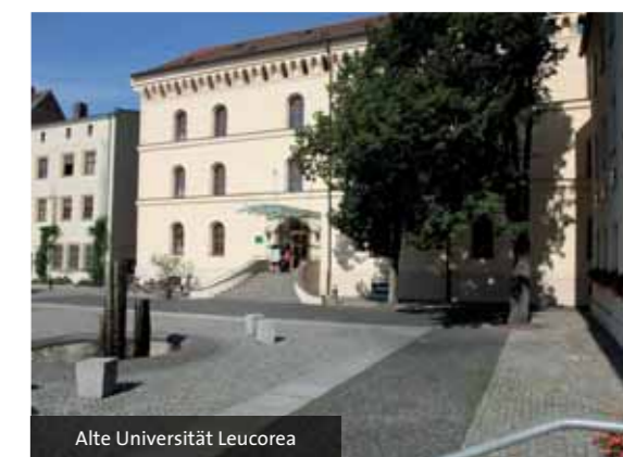
Alte Universität Leucorea